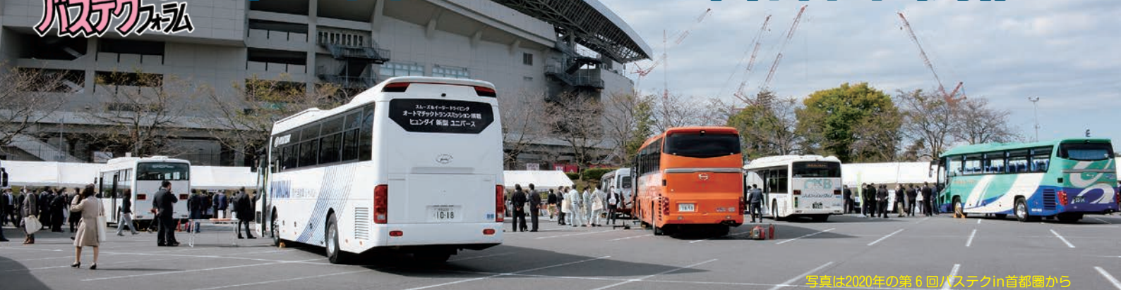
写真は2020年の第6回バステクin首都圏から

体験型バスイベント「第7回バステクin首都圏」を11月12日に開催します。“withコロナ”時代のバス運行に欠かせない感染症対策用品、事業発展のための新型車・サービス機器、さらに脱炭素社会に向けた電気バスや充電システムなど、いまのバス事業に必要な車両・機器・用品が勢揃い。秋の一日、バステクin首都圏にお越しください。